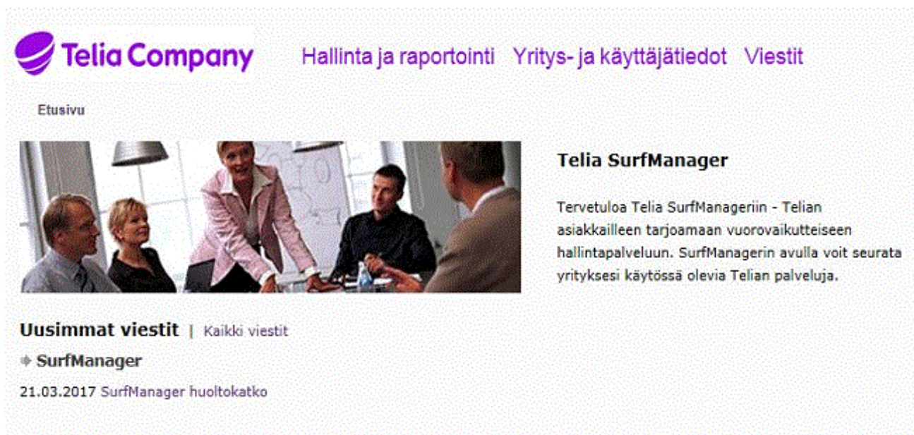
Kuva 3. SurfManagerin etusivu

Jos et löydä linkkiä Cid Manageriin, käyttäjätunnuksellesi ei ole annettu Cid Managerin käyttöoikeuksia. Ota tällöin yhteyttä organisaatiosi SurfManager- tai Cid Manager –pääkäyttäjään.